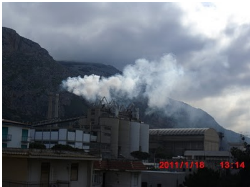
GIORNO 19 GENNAIO 2011