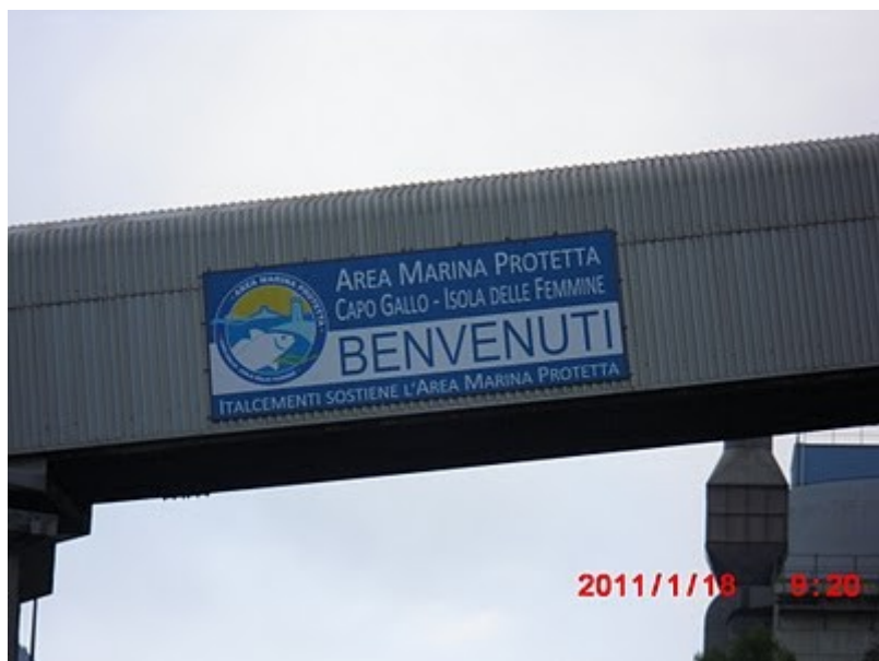
La Italcementi a salvaguardia dell'ambiente con annesso inquinamento